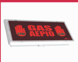
FL65 Στεγανό φωτιστικό σήμανσης κινδύνου με βαθμό προστασίας IP65